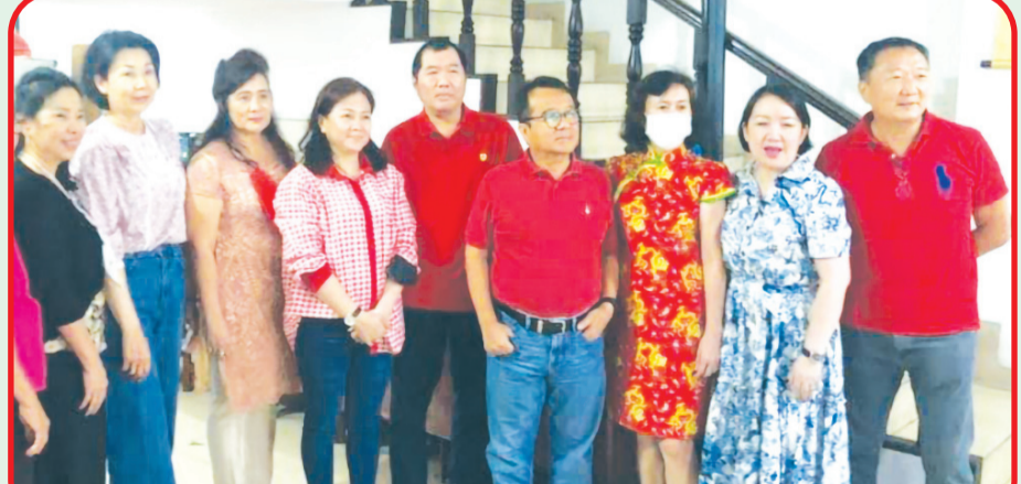
Pimpinan Yayasan Amal Kesejahteraan Anxi Indonesia berfoto bersama dengan warga lansia.