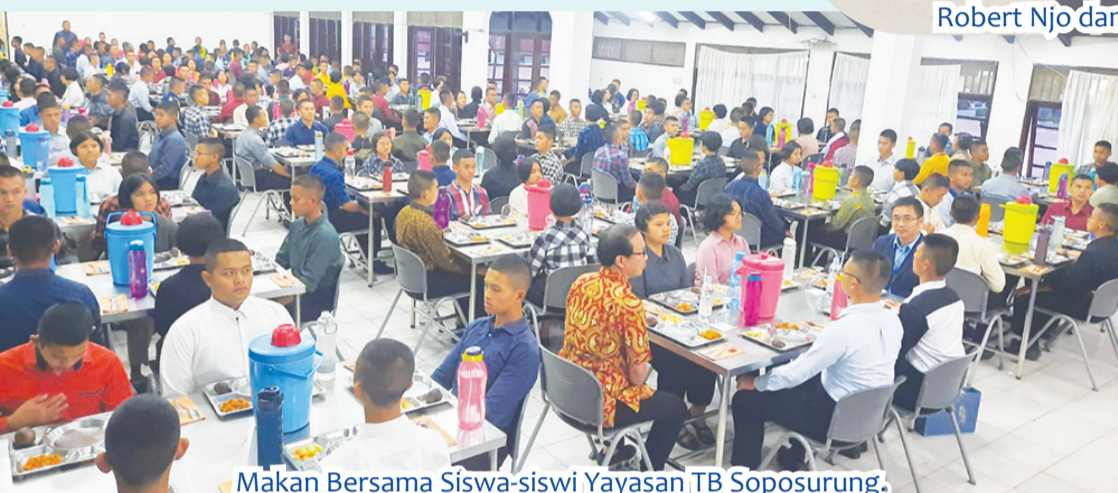
Makan Bersama Siswa-siswi Yayasan TB Soporung.

Diakui, udara di Balige juga sangat nyaman sehingga membuatnya tidak ingin cepat-cepat pulang dan berharap akan datang lagi ke Balige. ● kris