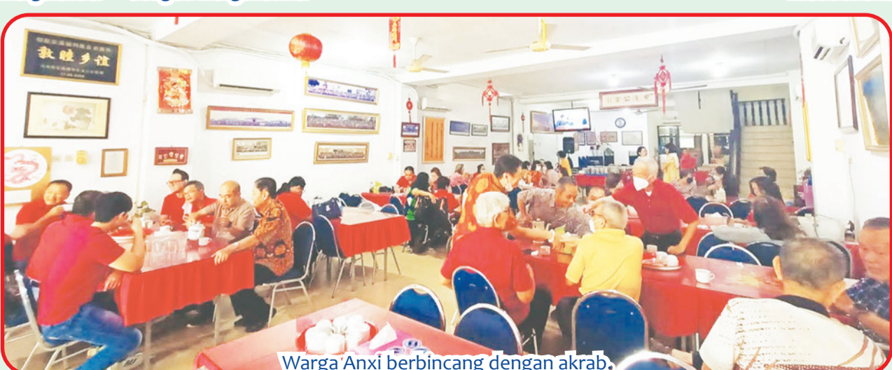
Warga Anxi berbincang dengan akrab.