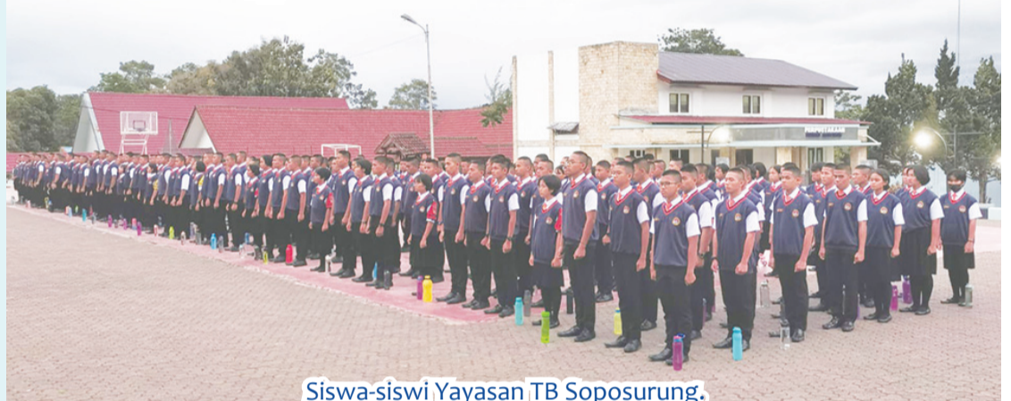
Siswa-siswi Yayasan TB Soporung.