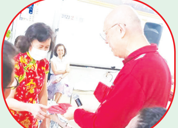
Pengurus Yayasan Amal Kesejahteraan Anxi Indonesia membagikan hadiah.

JAKARTA (IM) - Pengurus Yayasan Amal Kesejahteraan Anxi Indonesia Minggu (5/2) lalu menyelenggarakan Perayaan Cap Go Meh di kantor sekretariat mereka di Jakarta.