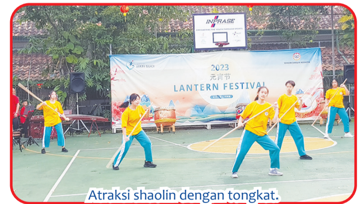
Atraksi shaolin dengan tongkat.