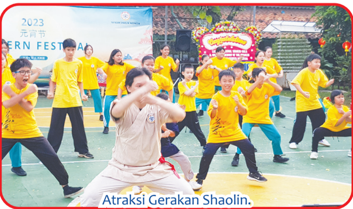
Atraksi Gerakan Shaolin.

Diharapkan pengembangan di Indonesia, menjadikan masyarakat Indonesia memiliki kualitas kesehatan dan kehidupan lebih baik. ● bam