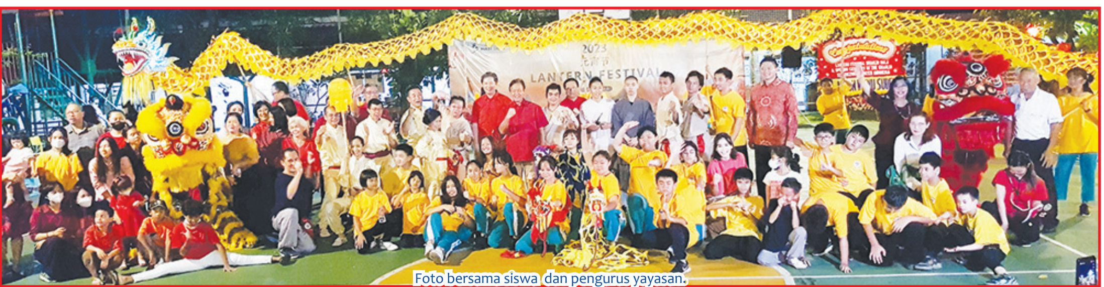
Foto bersama siswa dan pengurus yayasan.